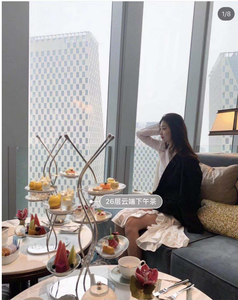
生活需要一点甜甜🌈杭州新晋云端下午茶打卡