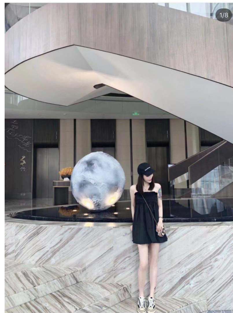
杭州新晋网红酒店🏨康莱德