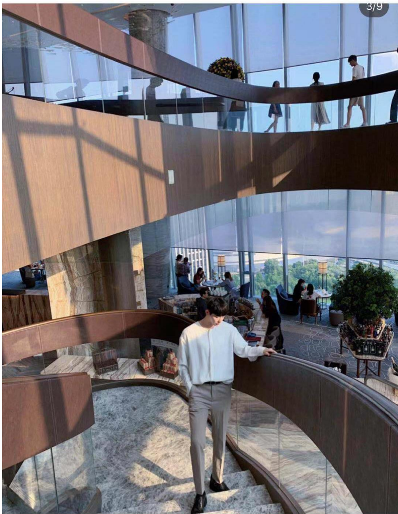
杭州酒店下午茶|康莱德高空云端下午茶☕